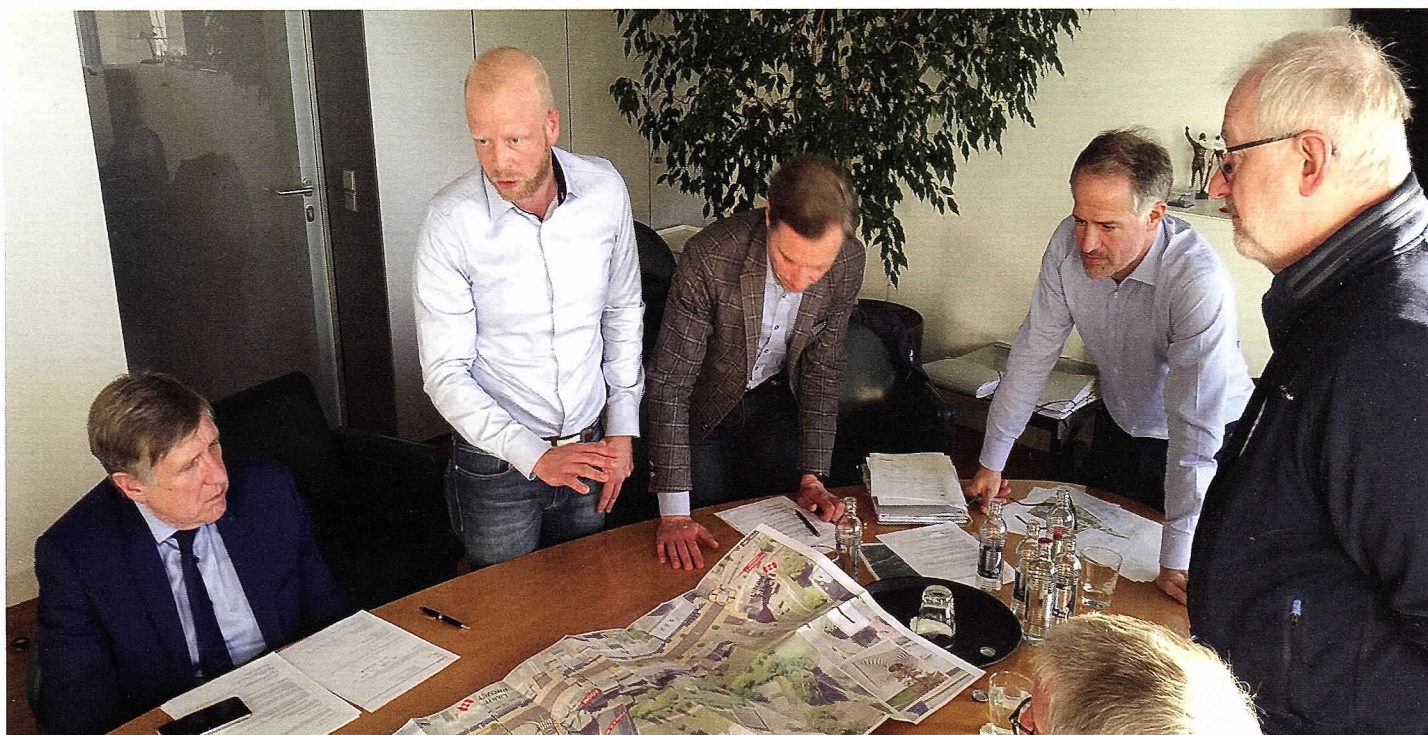
Entrevue am MDDI mam Minister François Bausch

Le Ministère ne souhaite lancer le projet avant que toutes les emprises nécessaires au projet, y inclus dans la vallée de l'Alzette, n'aient été acquises.