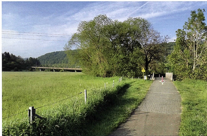
Velospiste Miersch-Schëndels: endlech schéngt et lass ze goen!