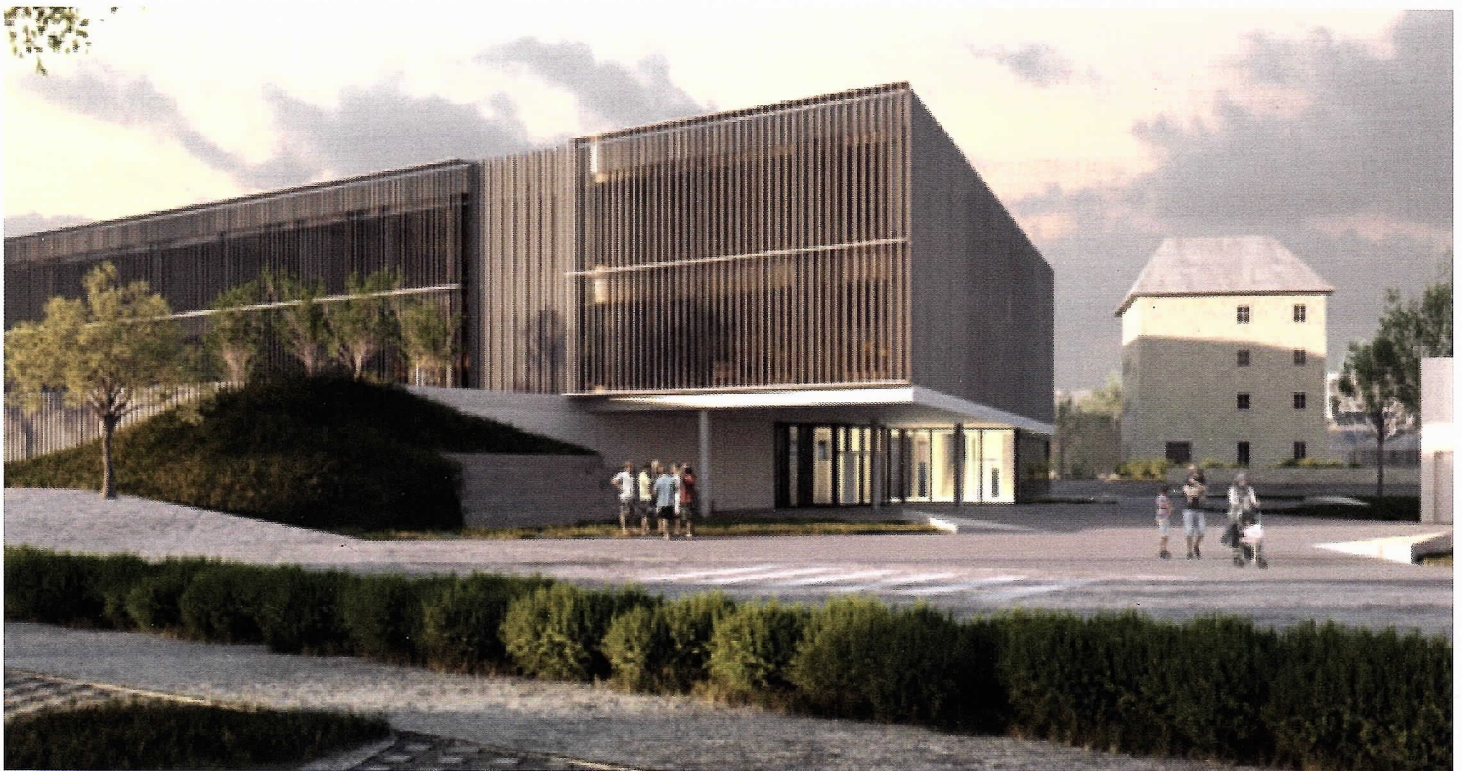
De Gewënner vun der « consultation rémunérée » fir eng nei Schoul mat Turnhal a Schwemm.

Pour les traductions, veuillez consulter notre site internet: www.miersch.greng.lu Übersetzungen der Texte finden Sie unter: www.miersch.greng.lu