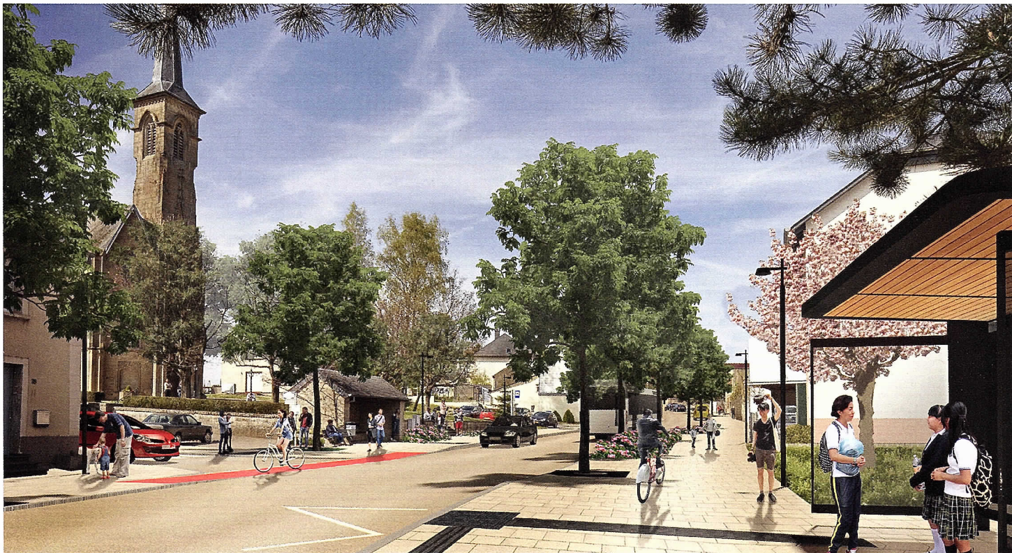
Méi Liewensqualität duerch den Réaménagement vun der RN7