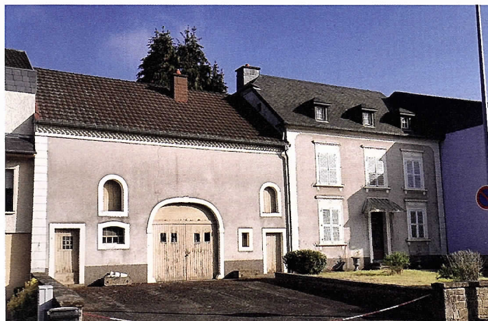
De Staat ass den neie Proprietär vum Haus Nr 26 an der Nic Welter Strooss

Bâtiment sous protection (gabarit protégé) que